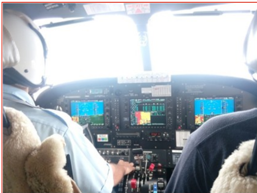
Tijdens onze vlucht naar Ukarumpa

Maar het is de eerste keer best lastig om te bedenken hoeveel voedsel je in die 8 weken nodig zal hebben. Je kunt niet te weinig meenemen, want dan heb je uiteindelijk niet zo veel meer te eten. Maar teveel meenemen gaat ook niet, want we mogen maar een bepaald gewicht meenemen in het vliegtuigje.